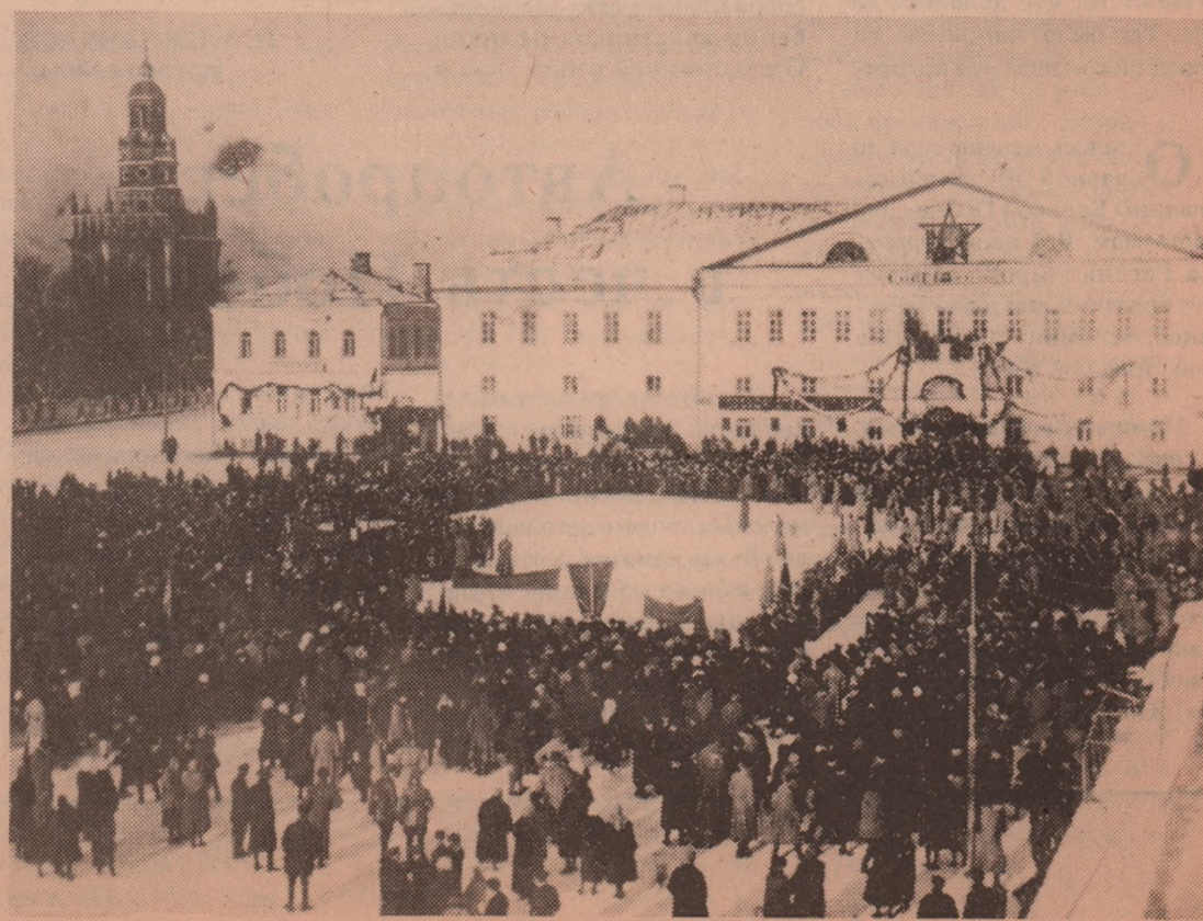
Закладка памятника В. И. Ленину в г. Сергиеве.