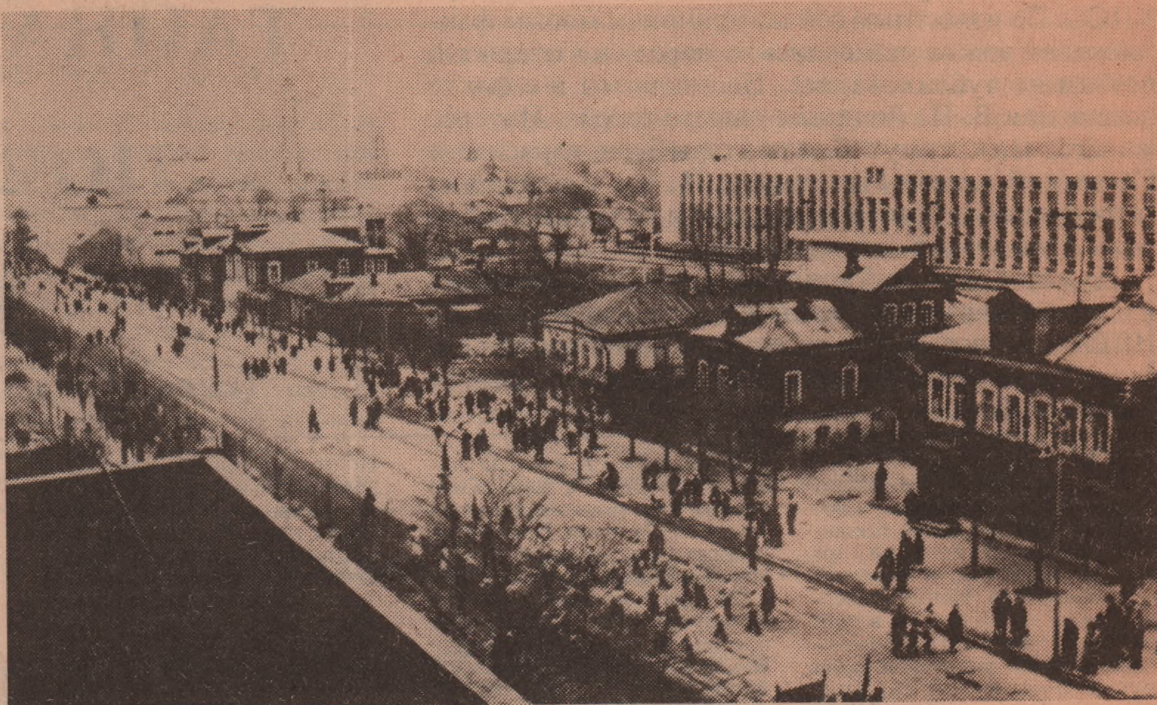
Загорск. 7 ноября 1969 года.