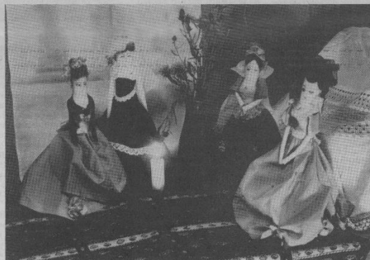
Эти куклы сделали дети. Они очень красивые, яркие и оригинальные, не похожие друг на друга. Жаль, что наши снимки не цветные.