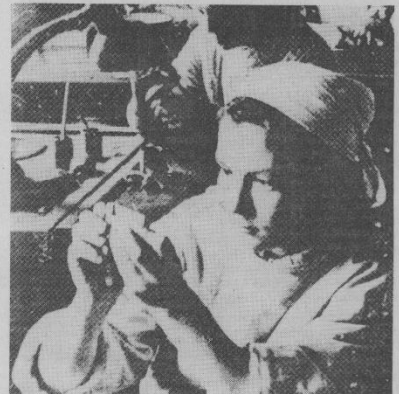
Сборка первых изделий ЗОМЗа. Фото 1938 года.

Так верь мне, друл! Войдет заря, И здравый смелст восторжествует Нет, мы работали не зря: Завод, ты есть! Ты существовал! Л. ГИРЛИНА.