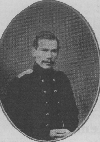
Л. Н. Толстой, 1856 г.