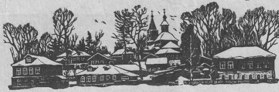
Иллюстрации к поэтическому сборнику "Сергей Посад". 1992.