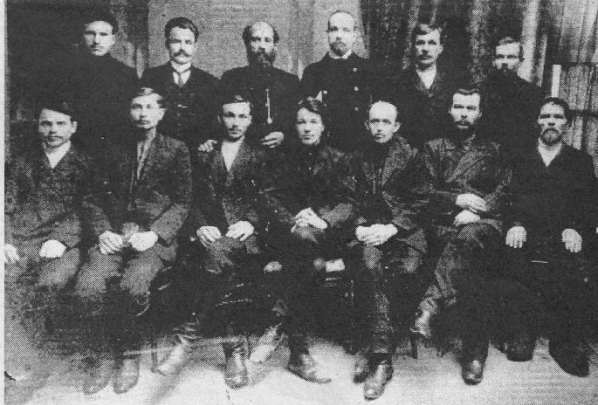
Мастера и преподаватели земской учебной игрушечной мастерской.