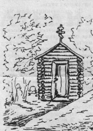
Вид часовни на месте пустыни. 1859 г.