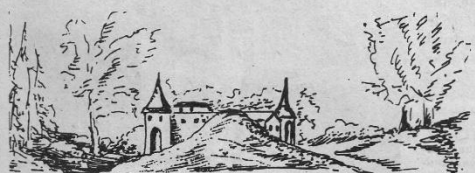
Вид Успенской Шавыкиной пустыни. 1765 г.

ловало больше десятка монастырей. Но уже во второй половине XV в. их число сократилось более чем в два раза, в частности, из-за недостатка населения. Религиозный погром XIV в. постепенно угасал, соответственно, уменьшалось число тех, кто ждал прироста прироста. В документах XVI - XVII вв. запущенные монастыри обычно отмечены как погосты.