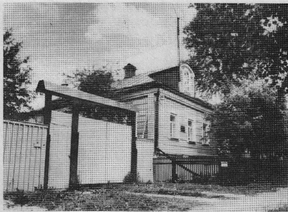
Люди и судьбы

Из книги "Василий Осипович Ключевский". Афоризмы. Исторические портреты и этюды. Дневники. М., "Мысль", 1993 г.