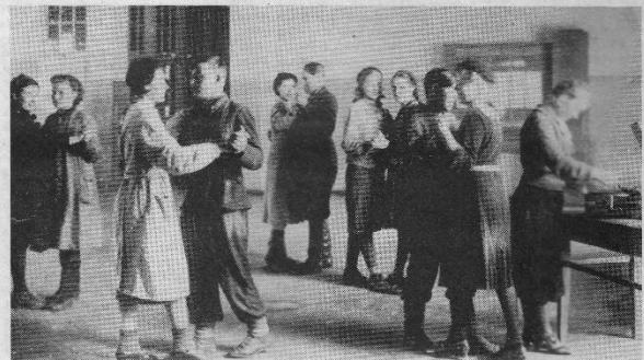
В редкую свободную минуту. Красный уголок ЗОМЗа. Снимок 1944 года.