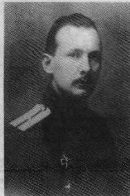
Александр Евгеньевич Трубецкий