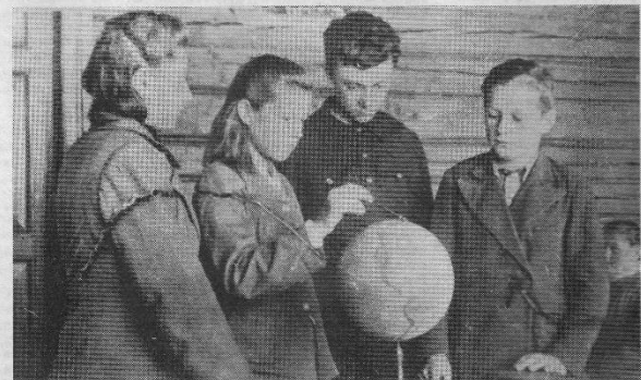
Урок географии в Мухановской школе. 1945 год.