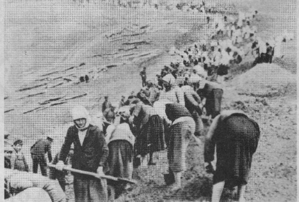
Строительство оборонительных укреплений. Август 1941 года.