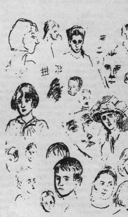
Наброски к картине "Трубеужки".

Аплодисментами встретили присутствовавшие стихи Иллариона Владимиро-