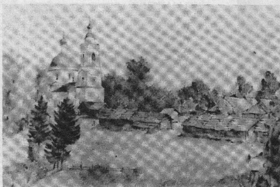
Вид села Глинково, 1927 год.