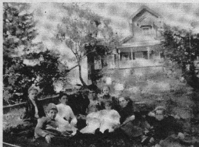
Семейство Вахмистровых у своего дома в Арханке.