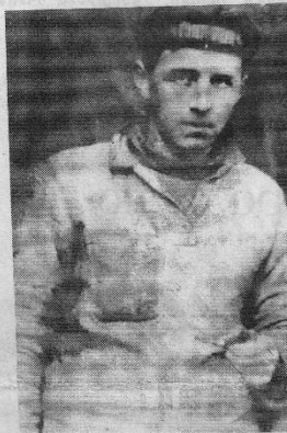
В. М. Голицын. Фото 20-х годов.

22 октября 1941 года, когда немцы подошли к Дмитрову, художника арестовали. Из Москвы этапом колонну "бышши" отправи-