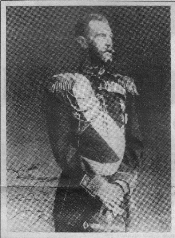
Великий князь Сергей Александрович Романов. Москва, 1894 г.