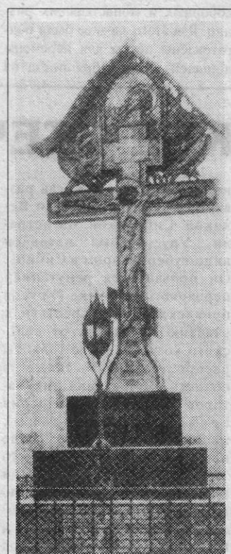
Бронзовый крест, возведенный 2 апреля 1908 года на месте убийства Великого князя Сергея Александровича.

В феврале 1905 года террорист Каляев бросил бомбу в московского генерал-губернатора Великого князя Сергея Александровича. Именем убийцы в первые годы советской власти была названа одна из улиц нашего города и детский дом для беспризорников. Этой "честью" эсер Иван Каляев был удостоен не случайно. Перед совершением террористического акта он два месяца по фальшивому паспорту жил в нашем городе, снимал комнату на Нижней улице. При аресте он не назвал своего настоящего имени, но на его сапогах была обнаружена метка "Магазин Моисеева в Сергиевом Посаде", поэтому полиция стала искать след преступника в нашем городе, показывая жителям его фотографию. За убийство Каляев был приговорен к высшей мере наказания - смертной казни.