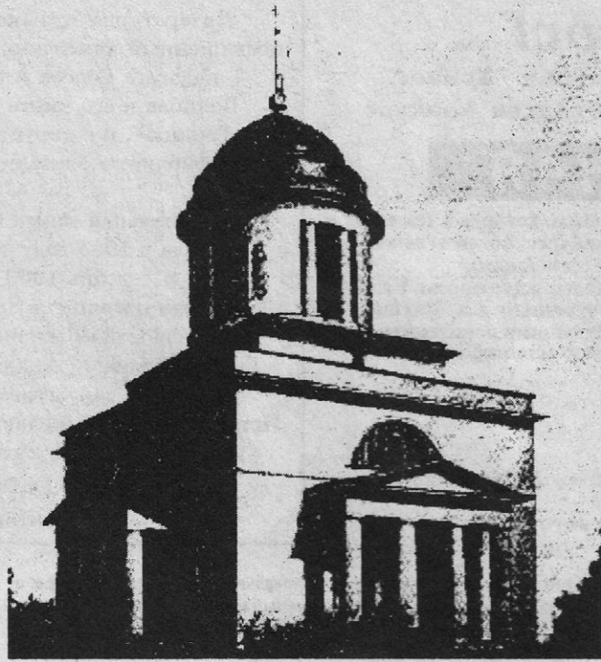
Неизвестный автор. Вид Воздвиженской церкви. 1847 г.

Осенью 1684 г. "учинился в селе Воздвиженском пожар и... государевы хоромы и в хоромех, что ни было, - все сгорело..." На месте пожара был спешно выстроен новый дворец. В мае 1730 г. в связи с готовящейся поездкой императрицы Анны Иоанновны в Троице-Сергиев монастырь было указано в селе Воздвиженском "построить хоромы в одну линию шесть светлиц да двои сеней. А строить те хоромы со всяким послешением". Появление этого указа было вызвано, вероятно, тем, что дворец конца XVIII в. пришел в полную негодность. Для скорого строительства требовалось большое количество разных мастеров, поэтому у монастыря были выпрошены плотники, столяры, печники и обойщики. В июле строительство хором было закончено. Это был послед-