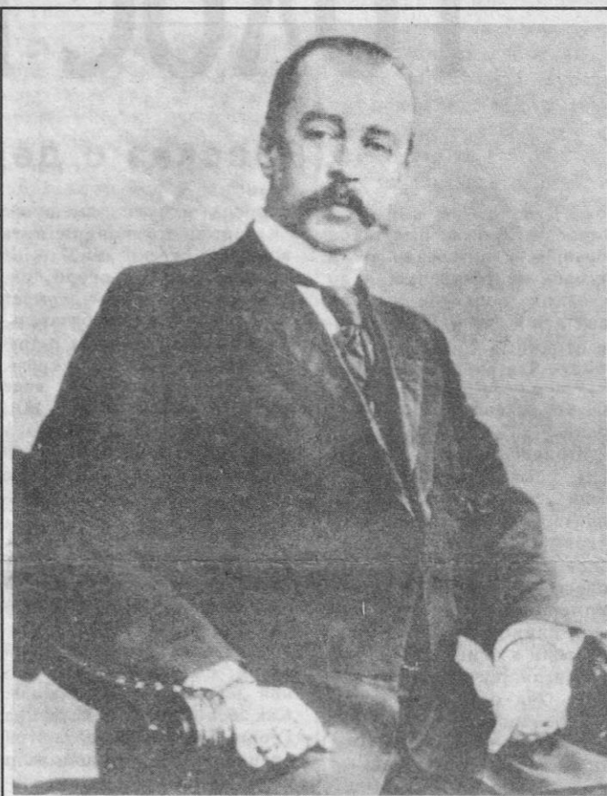
В. М. Голицын, гражданин губернатор Москвы с 1887 по 1891 год; городской голова Москвы с 1897 по 1905 год. Почетный гражданин Москвы.