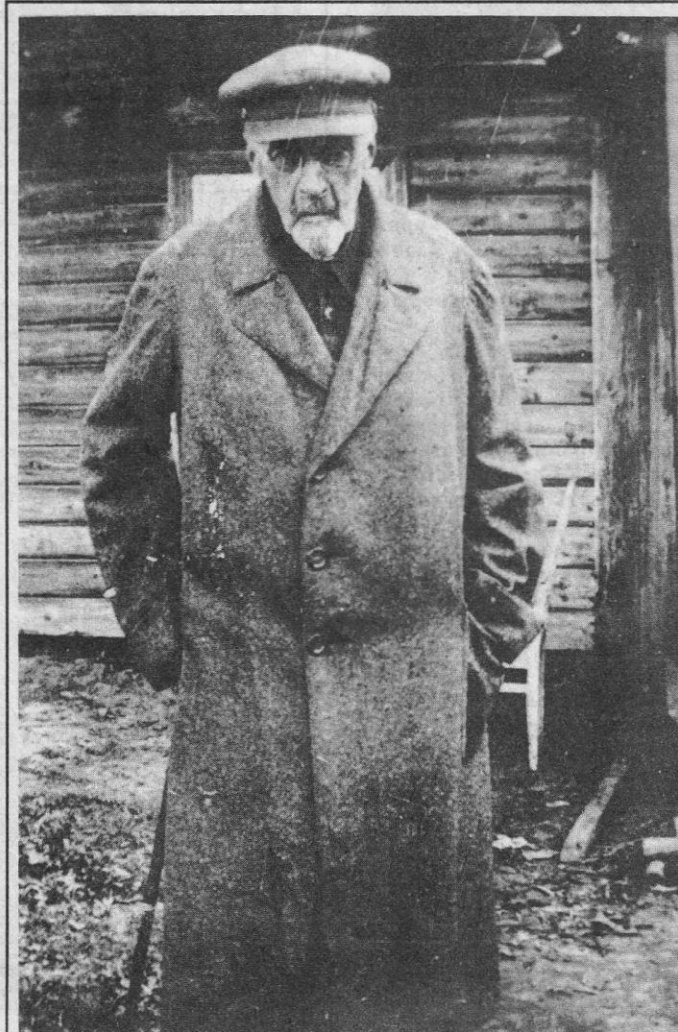
В. М. Голицын. Сергиев. Конец 20-х - начало 30-х годов.