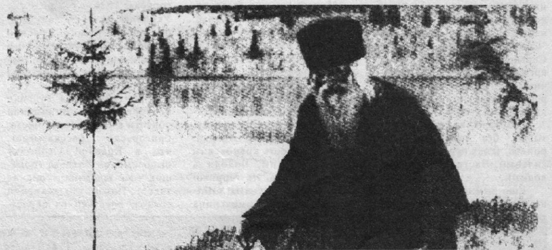
М. Нестеров. "Пустынный". 1916.