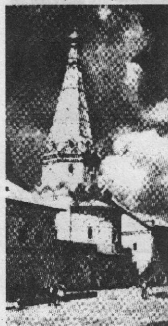
Церковь Зосимы и Савватия в Троице-Сергиевом монастыре

То, что церковь Зосимы и Савватия - памятник победы, подчеркнуто украшающими ее зелеными изразцами, на которых изображены воины и пушки. А строительство ее в комплексе с больничными палатами, раскинувшимся как два крыла взмывающего в небо шатрового столпа, видимо, должно напоминать о роли монастыря в лечении раненых и больных москвичей в 1611 году. Хотя палаты были предназначены для проживания престарелых монахов, само их название будило эту память.