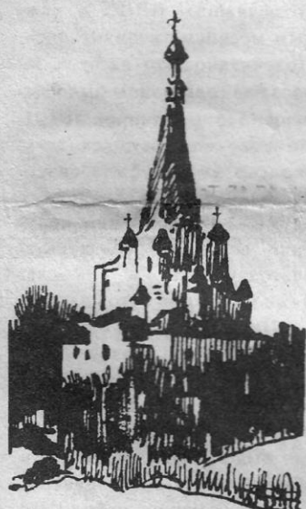
Церковь Покрова в Медведкове

Все знают памятник Козьме Минину и князю Дмитрию Пожарскому, поставленный на Красной площади через двести лет после освобождения нашей земли от поляков. Это первый скульптурный памятник в Москве. А в Древней Руси в честь выдающихся событий возводили храмы. Первым по времени храмом-памятником освобождения от польско-литовских интервентов была каменная церковь Покрова в Рубцове, заложенная царем Михаилом Федоровичем в 1619 году в его загородной усадьбе (ныне в черте Москвы).