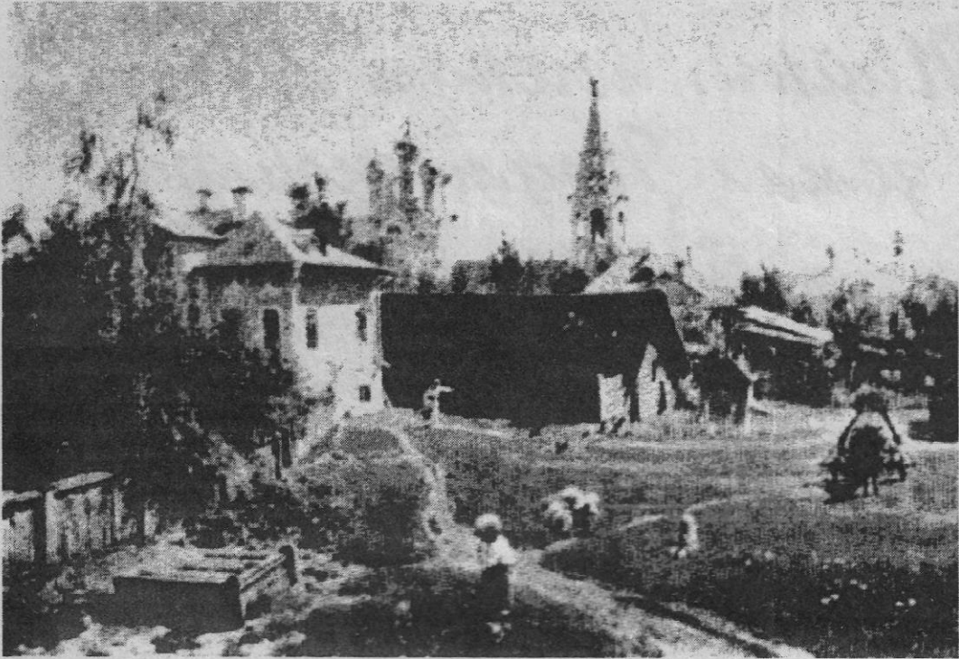
В. Поленов. "Московский дворик".