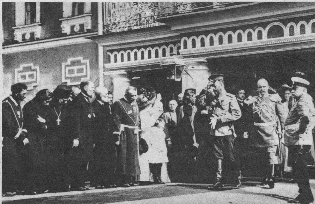
Император Николай II в Троице-Сергиевой лавре. Фото начала XX века.

Сейчас икона находится в Сергиево-Посадском историко-художественном музее-заповеднике.