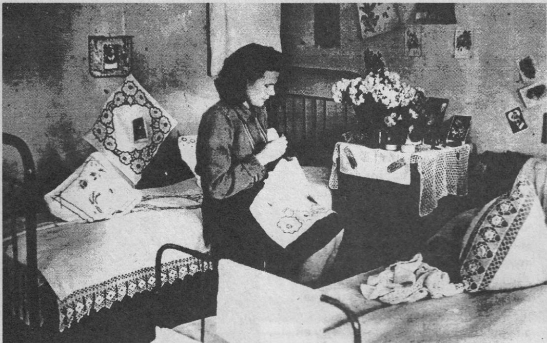
В одной из комнат заводского общежития.