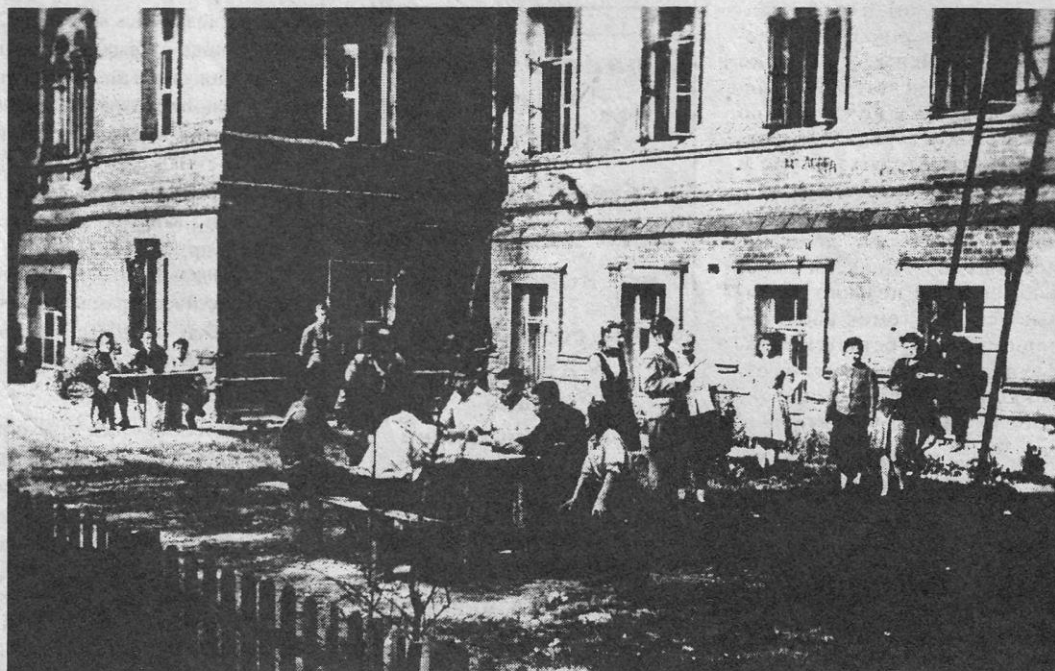
Здание бывшей 3-й горбольницы. После возвращения из эвакуации в нем жили работники ЗОМЗа.