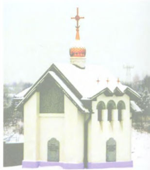
Макет проекта часовни и построенная часовня в п. Тарасовка