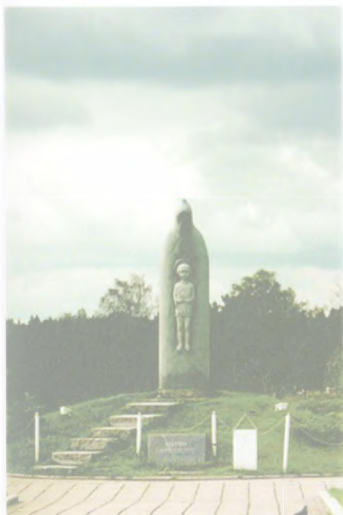
Памятник преподобному Сергию Родонeжскому (авт. В.Клыков, 1988 г.), с. Родонeж