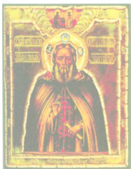
Икона Преподобный Сергей Родонeжский (кон. XVII — нач. XVIII вв.), СТСЛ