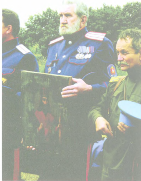
Обретение иконы «Святитель Димитрий Ростовский».