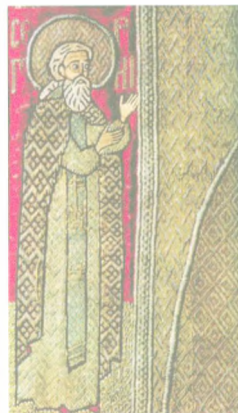
Преподобный Сергей Родонeжский (фрагмент пелены кон. XVI в.)

Младъ, и прелестъ, и божественъ, при снени глаголю приносити, при кладъ и нынѣ въ кресте стлан кити, и закиданици своей кошца, по полни на насъ въ глаголют своей, и глаголют нычъ и гласъ къ себѣ, по манастирѣ сви, еже самъ и вѣдана еси, и не за къ и приносити гласъ оуа, моли за плотски нынѣ, за дѣтство души вныа, и поимъ а дѣтство и крестъ